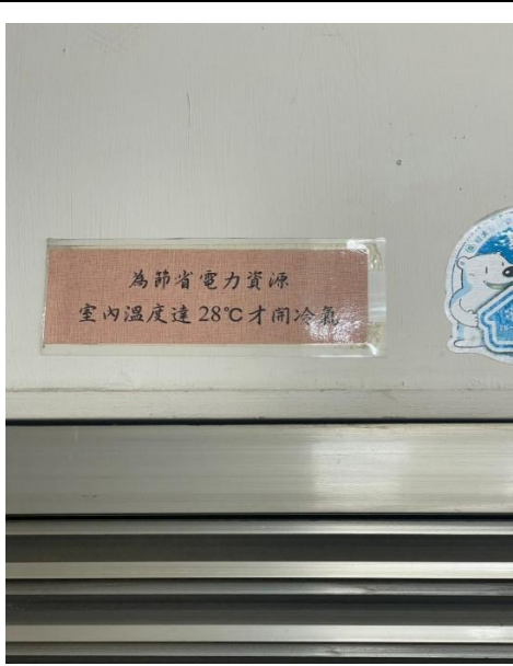
冷氣機旁公告節電公約