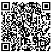
掃 QR CODE 進入報名表