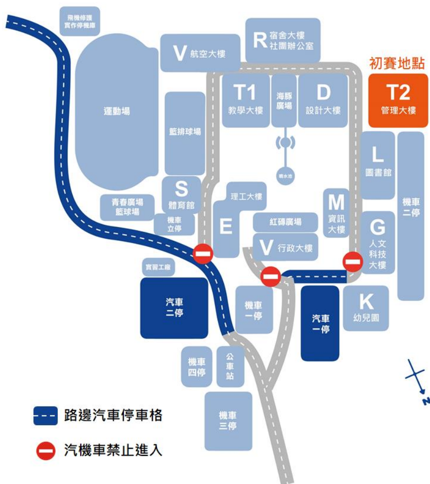
圖 3 朝陽科技大學校園平面圖

活動場地於「T2 管理大樓」，校園內提供免費汽車停車場（格），請見校園平面圖深藍色區域（如圖 3）。