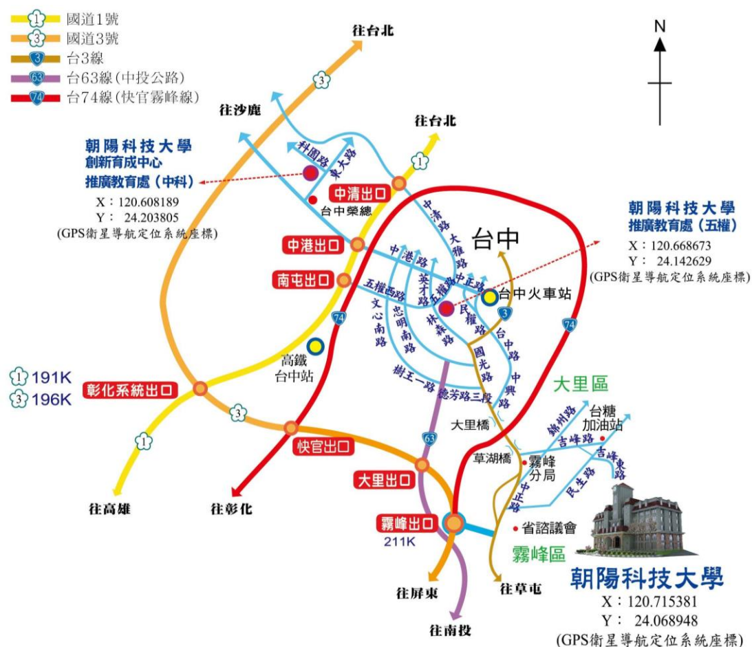
圖 2 朝陽科技大學交通示意圖

(一)交通方式：建議搭乘大眾交通運輸前往朝陽科技大學（臺中市霧峰區吉峰東路 168 號），交通示意圖如圖 2。