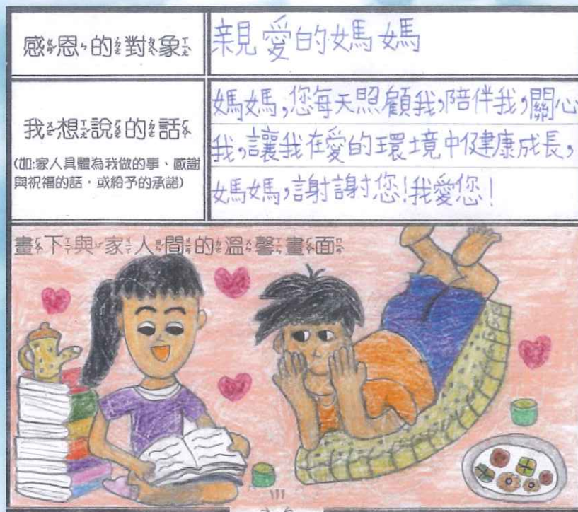
封底故事 - 感恩的季節 406林晏樑