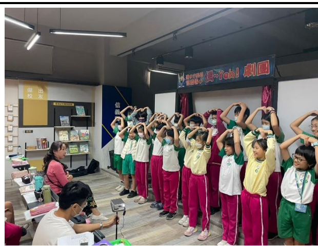
說明：教師指導學生演出效果