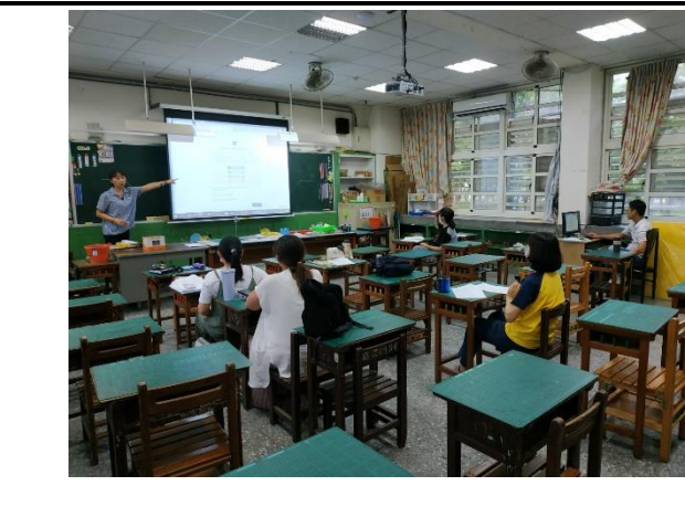
說明：偶戲教師社群研討