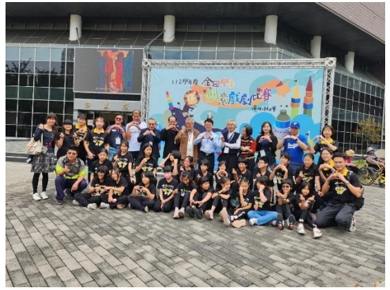
說明：20231129 參加台中市學生戲劇比賽初賽