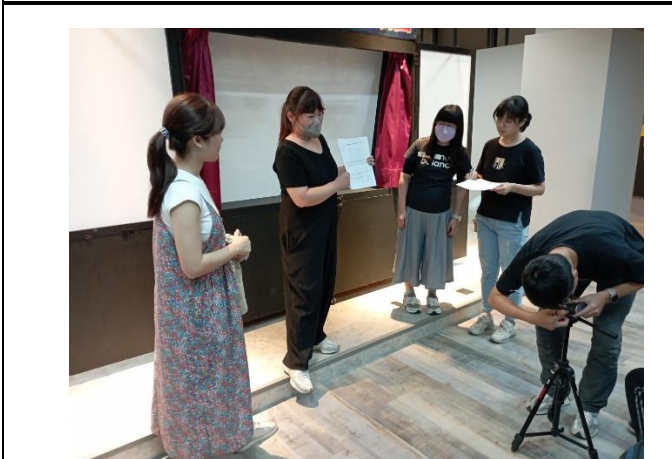
說明：偶戲教師社群研討