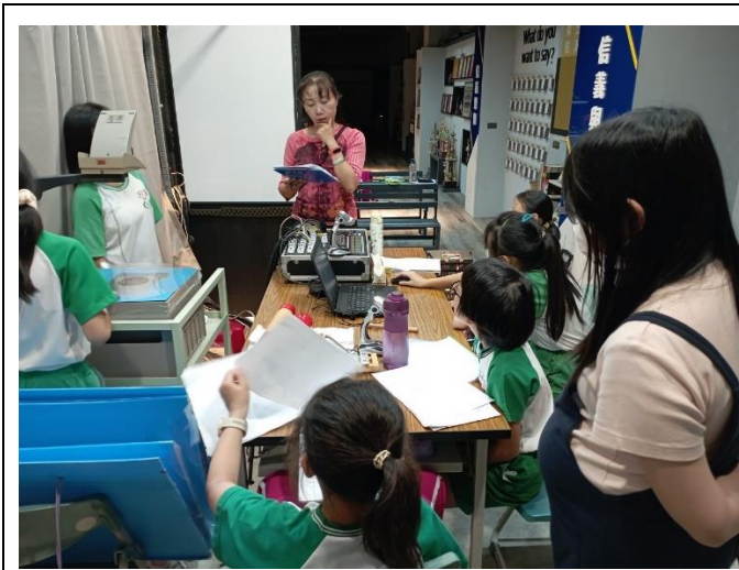
說明：教師指導學生配音配樂效果