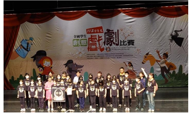
說明：20240411 參加全國學生戲劇比賽決賽 -新竹縣竹北文化局演藝廳