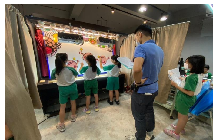
說明：教師指導學生演出方式