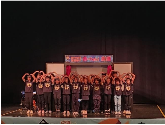
說明：20231129 參加台中市學生戲劇比賽初賽