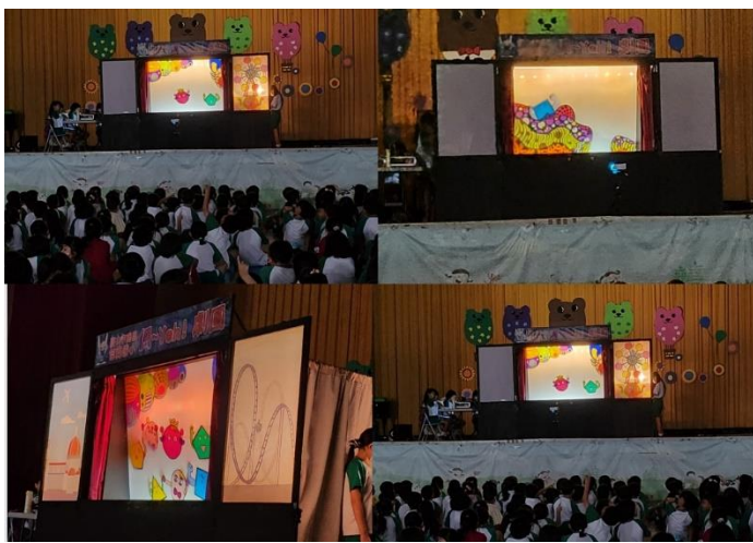
說明：信義偶戲團校內公演