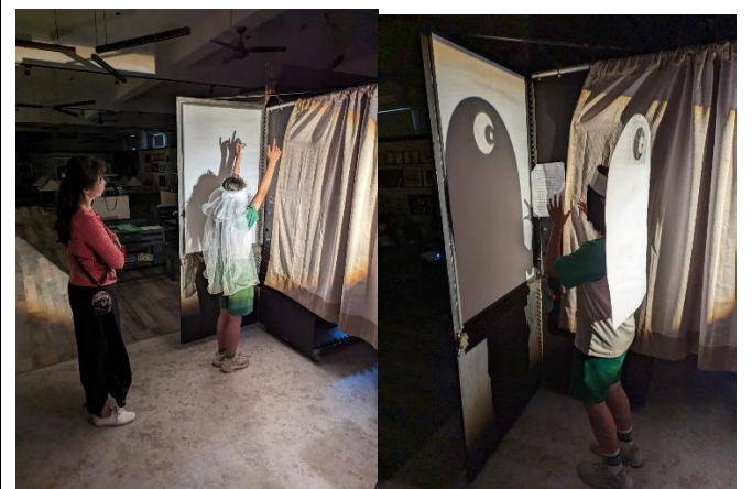
說明：教師指導學生演出表情與動作