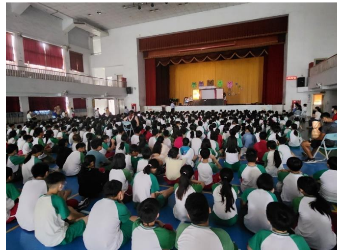
說明：信義偶戲團校內公演