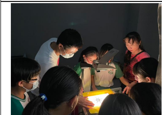
說明：教師指導學生演出效果