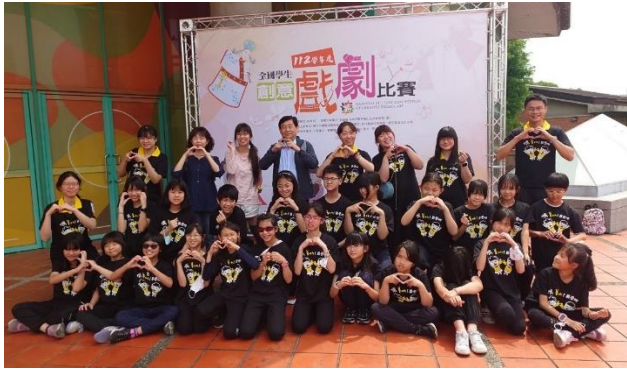
說明：20240411 參加全國學生戲劇比賽決賽 -新竹縣竹北文化局演藝廳