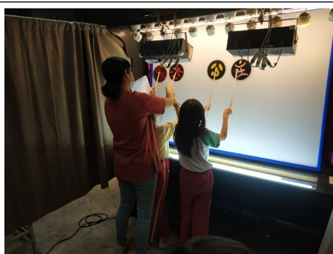
說明：教師指導學生操偶技巧