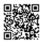
富邦產險 旅遊小管家專區