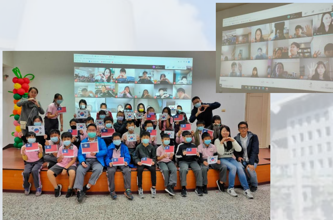
與首爾대도小學(Seoul Daedo Elementary School)進行文化學習