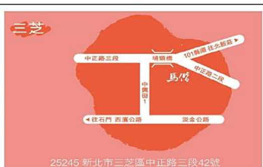
25245 新北市三芝區中正路三段42號