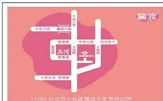
11260 台北市北投區關渡里聖景路92號