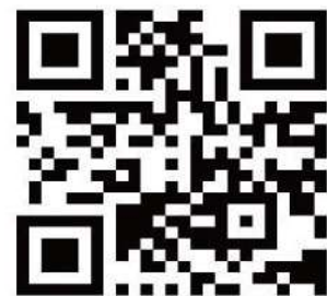
「台北海洋科技大學QR code」