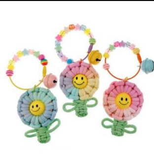
編織笑臉花花繩結鑰匙扣

🔗 活動方式：手作體驗共 4 項，每項活動皆辦理 6 梯次，每梯次 15 組，手作 30 分鐘，採 2 人 1 組親子報名。