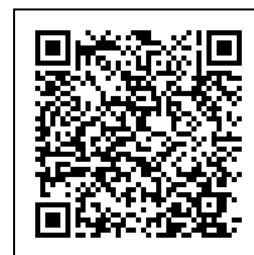
美術班 Facebook 粉專