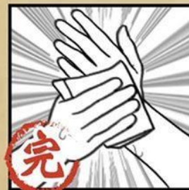
清水沖淨 並擦乾雙手