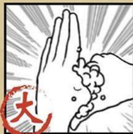
搓揉大拇指 及虎口