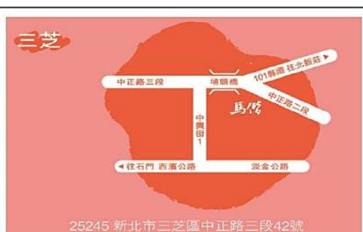
25245 新北市三芝區中正路三段42號