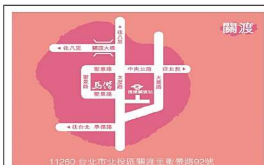
11260 台北市北投區關渡里聖景路92號