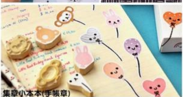
集章小本本(手帳章)