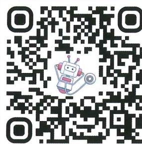
考後個人化成績回饋