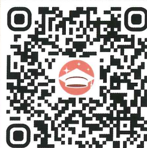
學習歷程證照代碼查詢