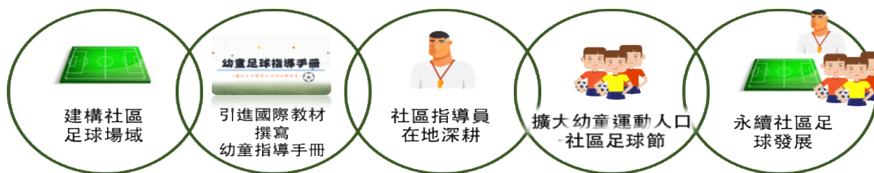
圖 2 深耕計畫核心理念

有了場地扎根，更需要人才在地深耕。當地方上具備足夠且適合的場地，可促使足球活動常規化進而發展社區足球，達到足球在地深耕的目標。發展社區足球需要投入大量在地人才，除了在地的教練與老師，未來可以結合地方或社區大學培訓有興趣的大學生做為「足球尖兵」，加強社區足球的組織化，並用「大朋友帶小朋友」的方式共同享受足球的樂趣、提升指導幼童的效率。這個階段希望提供無經驗的幼童接觸足球的機會，建立兒童與其家庭對足球運動的正確認識與參與動機，增加在地經營的廣度。