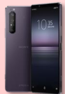
SONY Xperia 1 II

● 適用對象：臺中市政府及轄下機關員工、員眷、其他申辦資格請洽專員0934287668