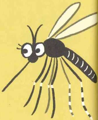
蚊子6根口針所負責的功能

吸血時，母蚊會將分布在嘴巴上、長得像吸管的針刺入動物的皮膚。蚊子的口針比人類的頭髮還細，肉眼看起來似乎只有1根，其實多達6根，收納在宛如劍鞘的嘴部結構裡。