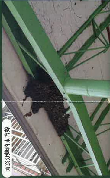
圖為分蜂的東方蜂