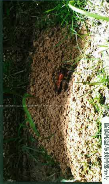
有些獨居蜂會鑽洞築巢

在國內常見之蜜蜂有兩個類群，分別為西方蜂(義大利蜂)及東方蜂(野蜂；中國蜂)，每年的3-4月為蜜蜂分蜂的月份，常有游離蜂群聚在電線杆、圍牆、住家等地方。