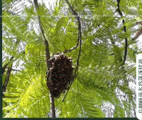
長腳蜂巢多為蓮蓬狀巢