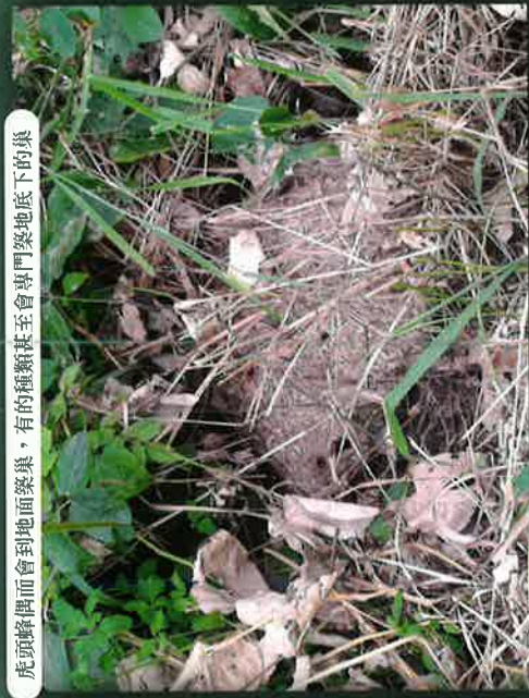
虎頭蜂偶會到地面築巢，有的種類甚至會專門築地底下的巢