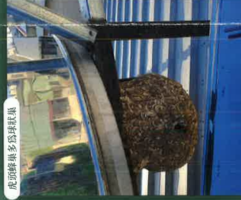
虎頭蜂巢多為球狀巢

危險度最高，民眾最害怕的類群，其會於每年4-5月開始築巢，工蜂會捕捉大量昆蟲來育幼，工蜂本身則食用一些花蜜、樹液。每年9月工蜂數量最多，巢內壅擠，且會開始產出新蜂王，故會較具攻擊性。