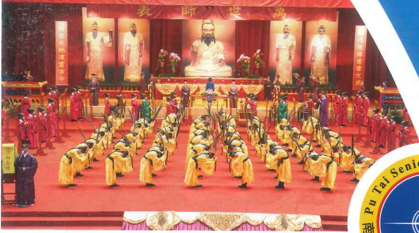
普台敬師釋奠禮，培養敬師勤學品格力。