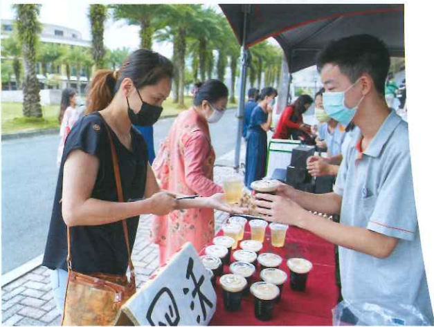
高二學生自發性籌辦義賣活動，送愛進偏鄉，關懷老人。