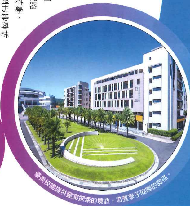
優美校園提供豐富探索的境教，培養學子開闊的胸襟。

與世界接軌的前瞻思 惟。小學開設能源科 技、實作探究及程式 語言社團課程，培養數 理邏輯及實驗素養；國 高中更開設專題研究、機器 人、程式設計素養班及科學、 語言學、資訊、地理、歷史等奧林 匹亞培訓課程。 化學式、方程式背不完？「普台科學 日」響應2020年「世界地球日」50週 年及第一屆「台灣科學節」，設計19個 DIY手工科學的操作體驗關卡，內容涵 蓋物理、化學、生物、地科及科技領域。 全校近千名師生透過遊戲式闖關活動， 看見卸下嚴肅外衣的科學展現活潑迷人 的一面，感受科學世界的豐富趣味和神