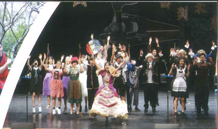
二外星光之夜，自信展現外語實力。