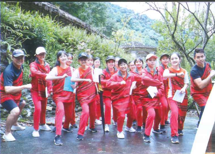
國三學生走讀肩溪，體驗原民傳統服飾文化。