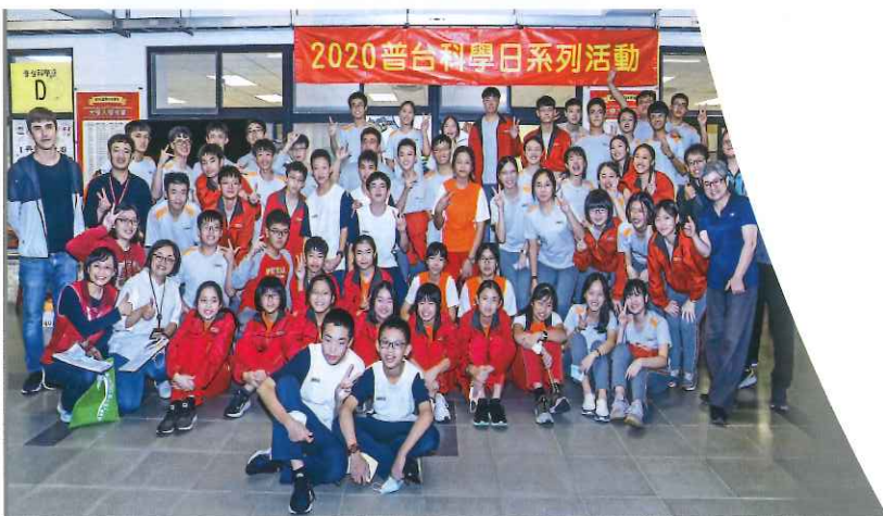
2020「普台科學日」，全校師生FUN手玩科學。