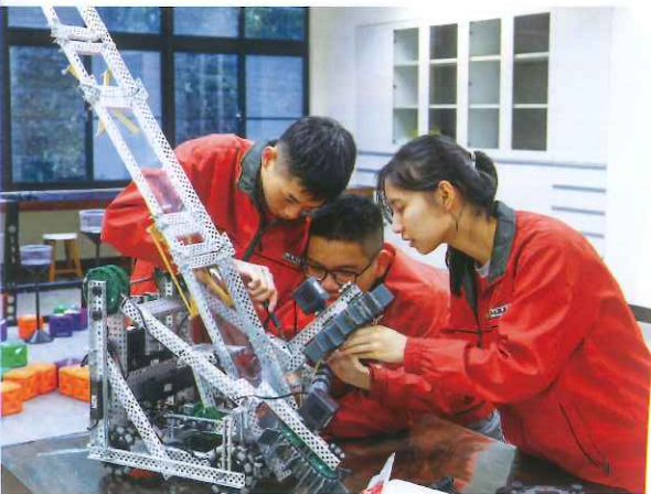
FUN學機器人課程，涵化數理科學素養。