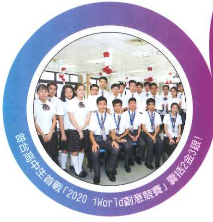
普台高中生首戰「2020 iWorld創意競賽」囊括2金3銀！