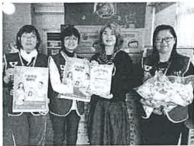
蜜蜂故事館捐贈 1 萬包台灣國產荔枝蜂蜜世界和平會雲林分會。

新冠肺炎疫情嚴峻，許多社福單位受捐助都減少，雲林縣古坑蜜蜂故事館今捐贈 1 萬包台灣國產荔枝蜂蜜、100 個手工香皂以及現金一萬元給世界和平會工作人員作為防疫使用。