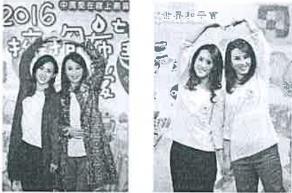
孫翠鳳（右）與女兒陳昭賢（左）代言中廣擁抱希望愛起跑義賣活動，孫翠鳳表示感謝各企業提供義賣品，幫助受飢兒。

為響應活動，孫翠鳳也捐出明華園 2017 年新戲「龍抬頭」10 張門票捐助，義賣所得全數捐給世界和平會「搶救受飢兒」服務。