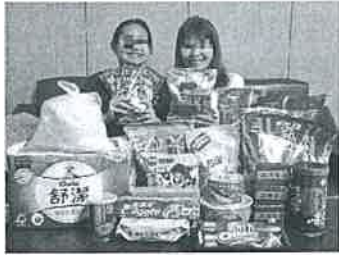
圖說：許多營養食品與生活物資讓小玉米和媽媽安心生活。

因為媽媽工作收入不穩定，以及身體狀況時好時壞，小玉米從國小就開始接受世界和平會的服務，從早餐、營養物資、寒暑假餐券讓小玉米不再餓肚子，懂事的小玉米過去經常有一餐沒一餐，卻因為瞭解媽媽的難處，不敢跟媽媽開口喊餓，總是自己默默忍受，結果使得自己胃痛成疾，甚至影響課堂的學習。還好世界和平會的餐食服務終止小玉米的飢餓之苦，再加上生活扶助金、保暖品等經濟和生活各方面的關懷，讓小玉米一路的成長都被支持和關心，也讓小玉米可以專心學業，減少後顧之憂。