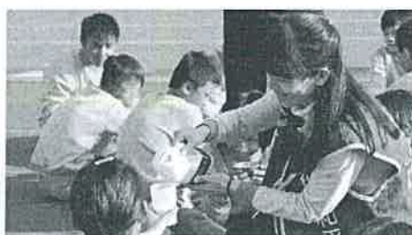
世界和平會提供愛心鮮奶為「圓夢計畫」的孩子補充營養。