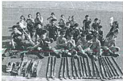
桃園武漢國小曲棍球隊拿下108年全國總統盃曲棍球錦標賽冠軍。

世界和平會長期關懷兒少福利與慈善公益不遺餘力，世界和平會認為照顧好一個孩子，社會就多一個有希望的人生。近20年來，世界和平會除長期提供危機兒、受飢兒「愛心早餐」相關服務之外，更持續提供資源支持偏鄉學童「圓夢服務」。