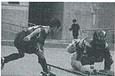
「圓夢服務計畫」幫助孩子找到人生的方向和奮鬥的目標。

營養餐食是孩子學習成長的重要後援，世界和平會不只提供物質上的幫助，也會親自關心孩子們的生活狀況，陪伴孩子實現夢想。孩子們心存感恩，比賽時總是充滿鬥志，武漢國小孩子也拿下「108年全國總統盃曲棍球錦標賽冠軍」來答謝成長路上所有幫助他們的善心人士。