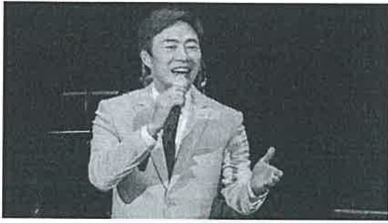
▲費玉清開唱前僅吃一顆茶葉蛋。