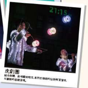
虎劇團 結合耍猴、耍嘴、耍棍、耍球, 展現於傳統的扯鈴與魔術, 以創新的面貌呈現。