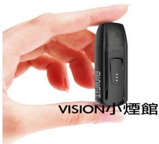
照片說明：電子煙主機(範例)