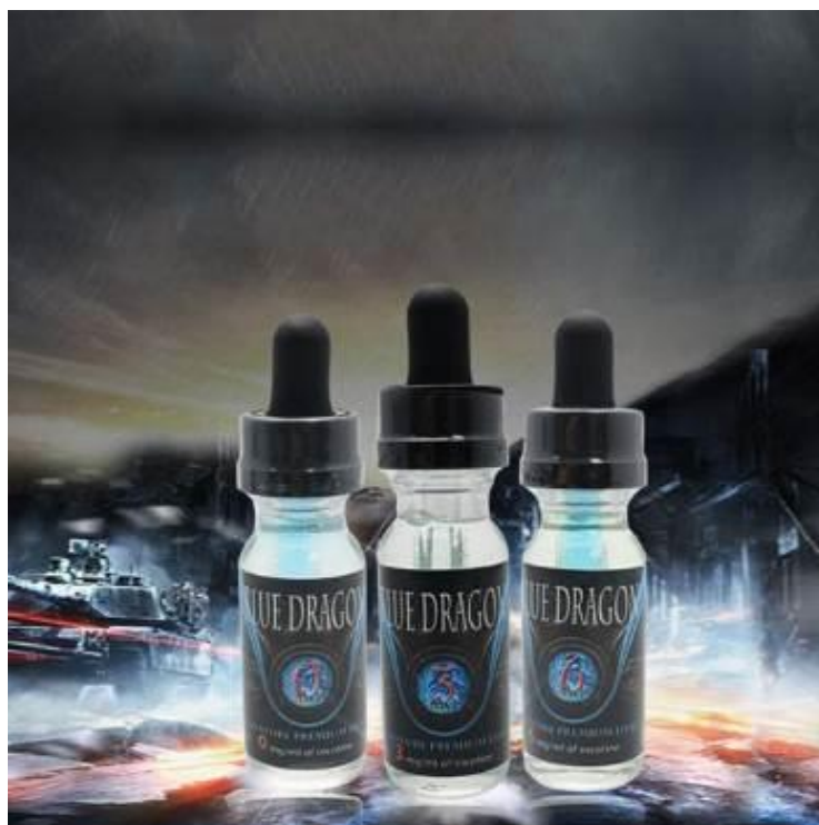
照片說明：電子煙煙油(範例)