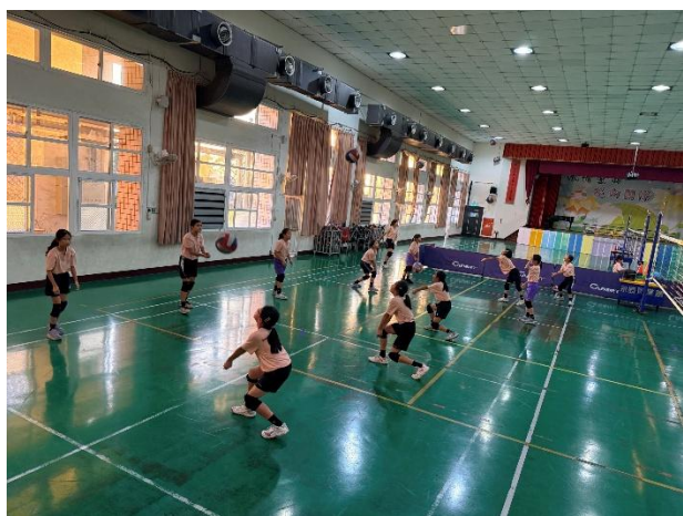
活動說明：對傳練習