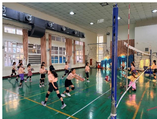
活動說明：團隊練習