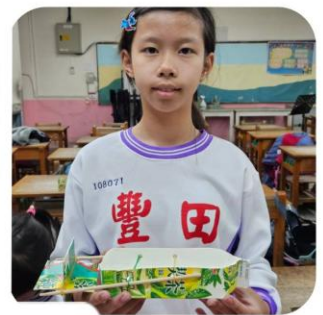
新鮮屋搖身一變環保船 和我們一起拯救地球！