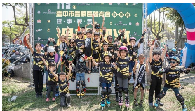
活動說明：大合照（三）