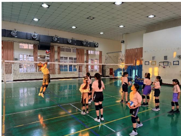
活動說明：扣球練習