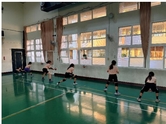
活動說明：發球練習