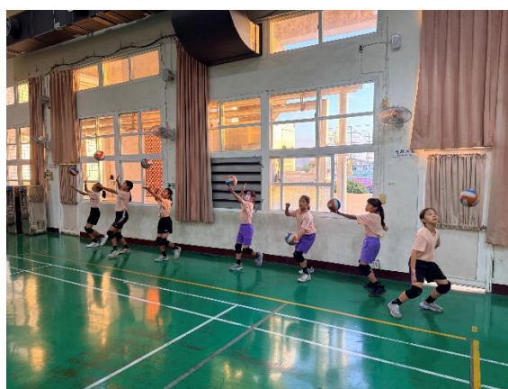
活動說明：發球練習