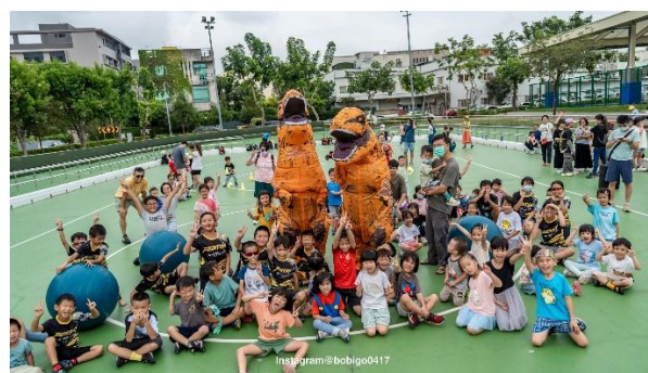
活動說明：大合照（二）