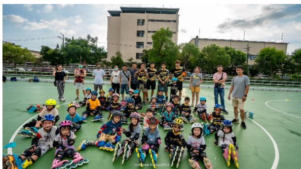
活動說明：大合照（一）