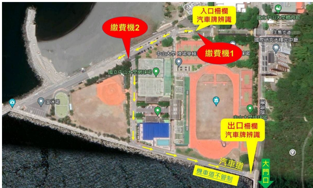
圖 2、海堤停車場繳費機位置