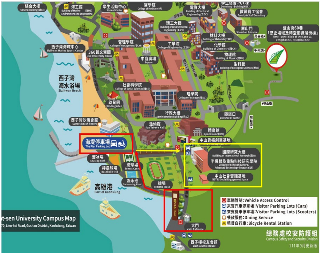
圖 1、海堤停車場與會場往返路線