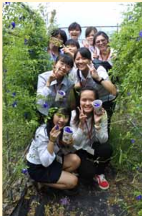
學生手中拿的是「蝶豆花」。