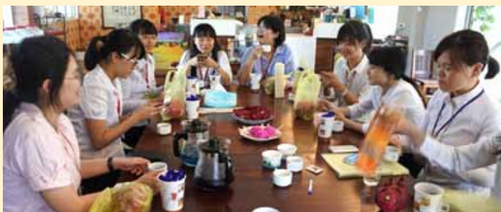
學生在農場摘的「火龍果」、「蝶豆花」，可製成「火龍果冰淇淋」、「蝶豆花茶」（如圖示桌面），極具營養價值。