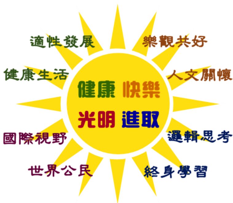
【學校願景/學生圖像】