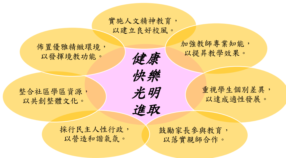
【學校願景/學生圖像】