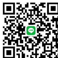
0426滾球大集合 line 群組