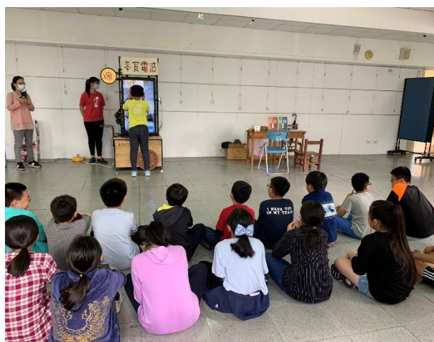
麥寶電波體驗活動紀實 1