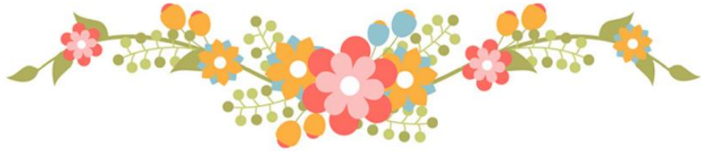
臺中市五大道國民中學 111-2 學生作息時間表