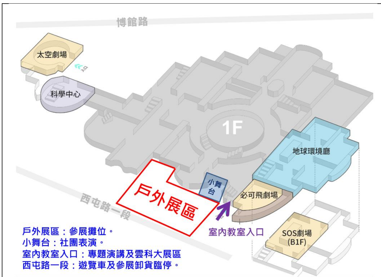
圖一：科博館室外圖。