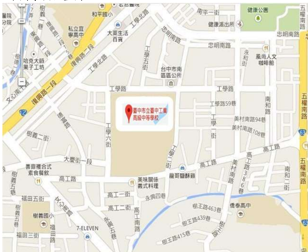
附圖一 承辦學校位置圖