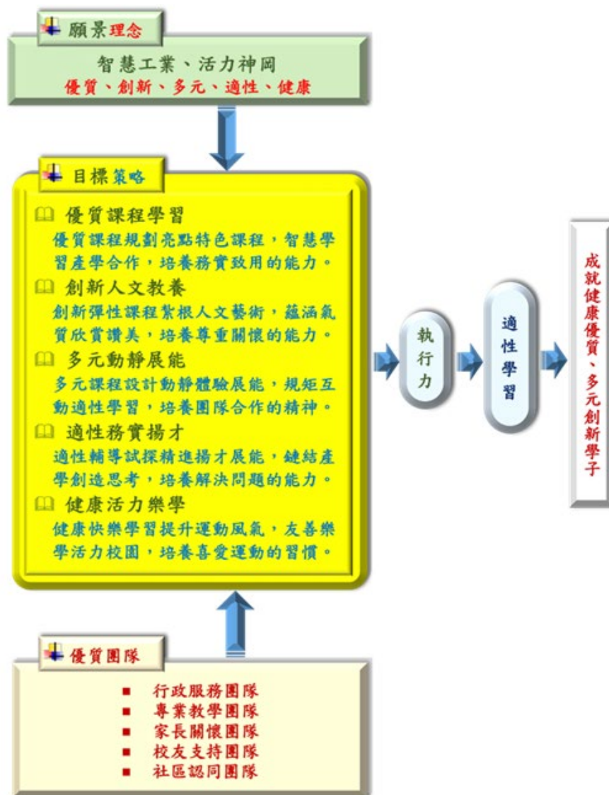
圖二 願景理念及目標策略關係圖