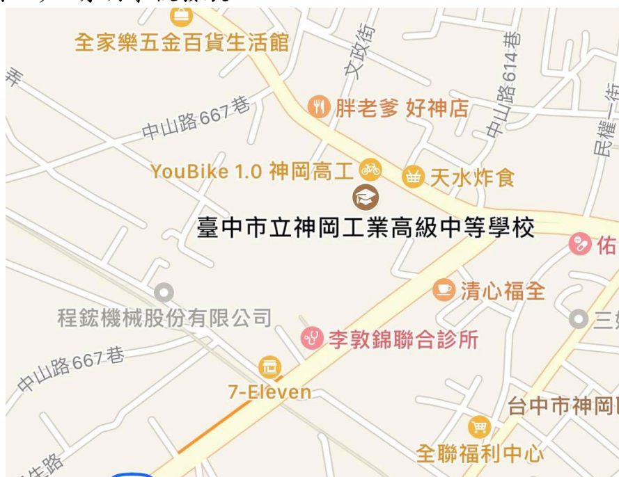
圖一 臺中市立神岡工業高級中等學校位置圖

臺中市立神岡工業高級中等學校改制前為臺中市立神岡國民中學，創校於民國45年11月22日，坐落神岡區社南里，交通便利，且為神岡區精華地帶（如圖一），有利學校發展。