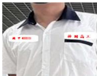
圖一 制服繡製樣態