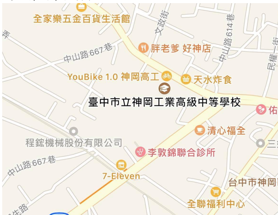
圖一 臺中市立神岡工業高級中等學校位置圖

臺中市立神岡工業高級中等學校改制前為臺中市立神岡國民中學，創校於民國45年11月22日，坐落神岡區社南里，交通便利，且為神岡區精華地帶(如圖一)，有利學校發展。