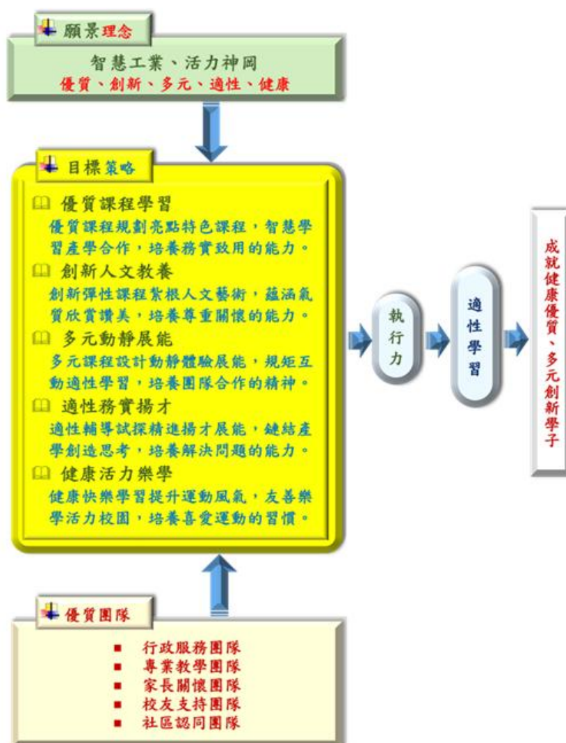
圖二 願景理念及目標策略關係圖