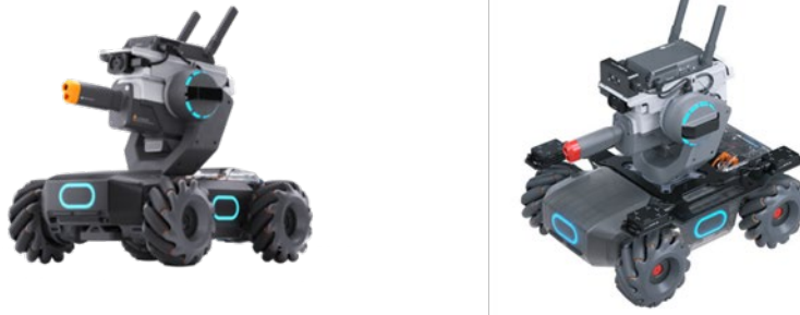
[圖一] 參賽機器人示意圖