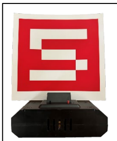
[圖二] 固定標靶示意圖