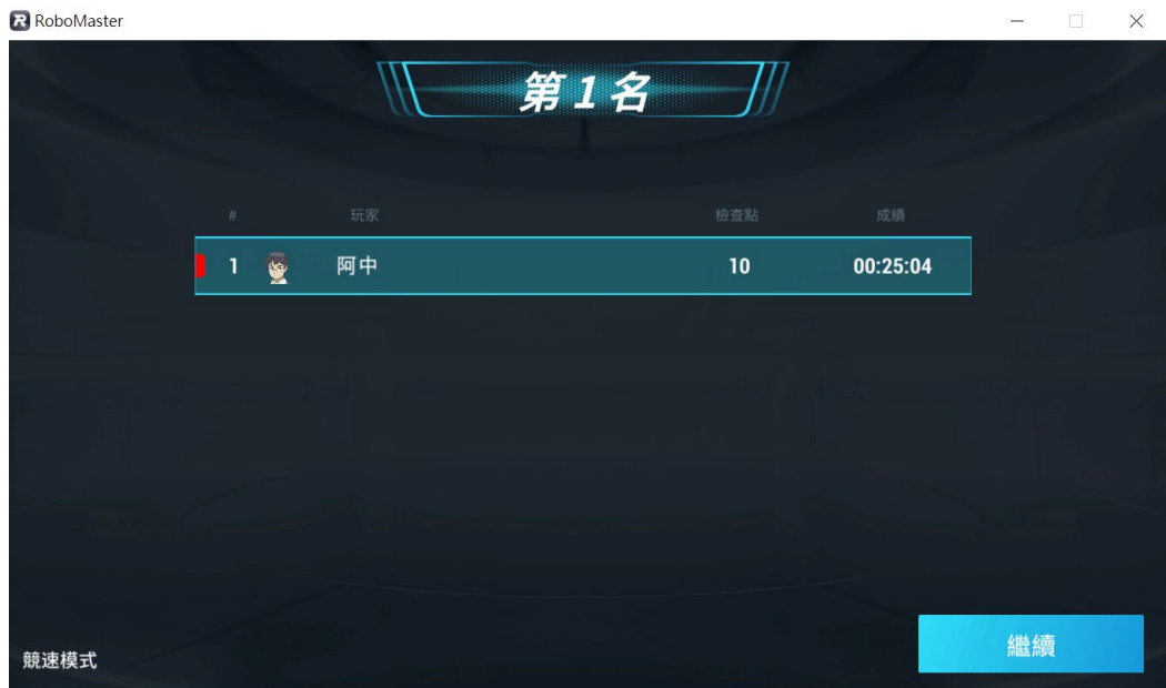
[圖六] 競速模式分數顯示示意圖