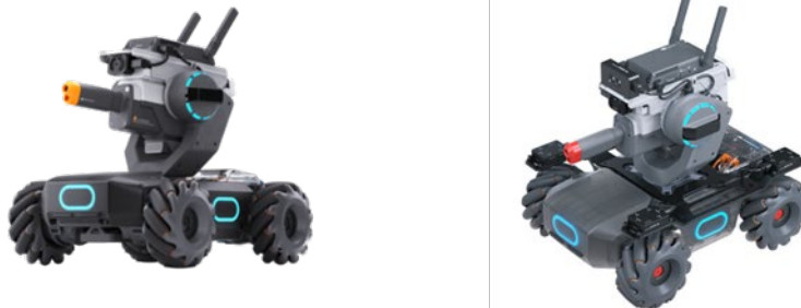
[圖一] 參賽機器人示意圖